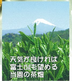
天気良ければ富士山も望める当園の茶畑